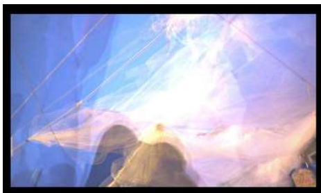
Fotograma del trabajo de J.C. Quindós “15-M-51”

Sus investigaciones artísticas gravitan alrededor del espacio y la ciudad contemporánea mediante herramientas fotográficas, sonoras y cinematográficas, usadas de forma transversal. En otra línea plástica desarrolla proyectos reinterpretativos sobre la obra de artistas como Jorge Oteiza o Juan de Herrera. Su obra ha sido expuesta en diversos museos en exposiciones individuales y colectivas, como el Museo de Arte Contemporáneo Patio Herreriano, el Museo Nacional Cerralbo, la Sala de Exposiciones de la Pasión, el Colegio de Arquitectos de Castilla y León, o la U.I.A.V.