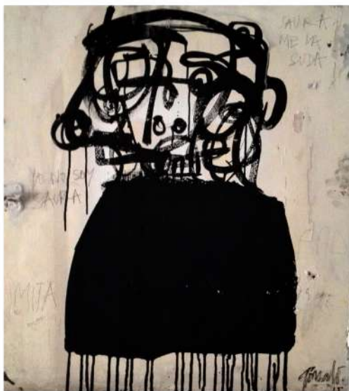
“Saura me la suda” obra de Gonzalo de Miguel

Gonzalo de Miguel Villa ( www.gonzalodemiguelvilla.wix.com ) Como un dibujo infantil, como la primera idea que esboza tu mente y se plasma directamente en el lienzo. Un informalismo vehemente. Sin querer resolver las técnicas de la academia. Expresión directa e inconsciente de lo ingenuo. Jugando con una ironía disfrazada de mundo infantil. Con rasgos toscos, pinceladas absurdas, muchas veces sin una intención en concreto más que el ímpetu de crear y visualizar y reflexionar, sin que el tiempo y la técnica artística tenga el privilegio de ser lo primero en valorar.