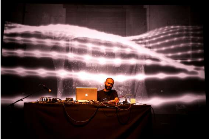
Ejemplo del trabajo de Birikú Sistema Sesión de Niño en SONAR barcelona 2015