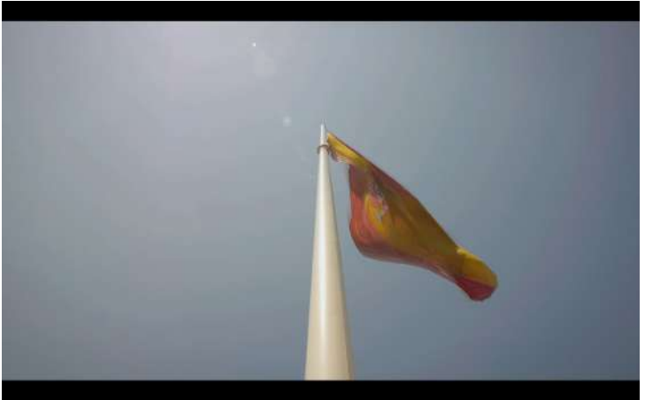
Fotograma del trabajo de J.C. Quindós en “Preferirá no hacerlo”