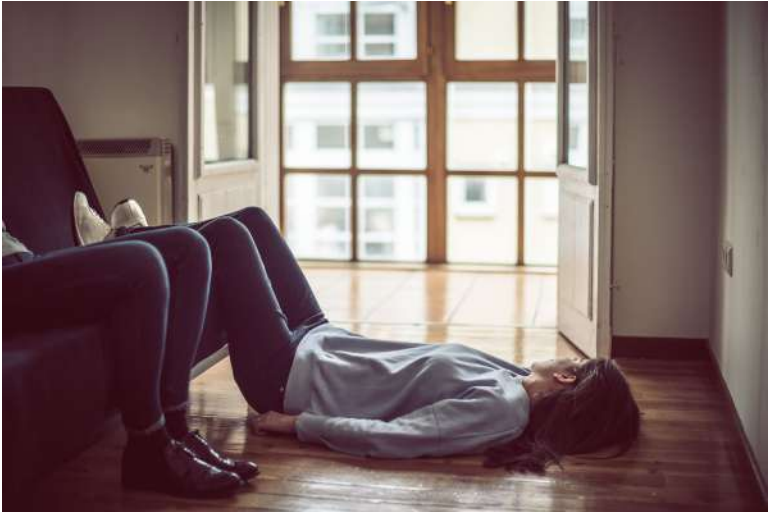
Fotografía de “Colectivo Resituación” por J.C. Quindós