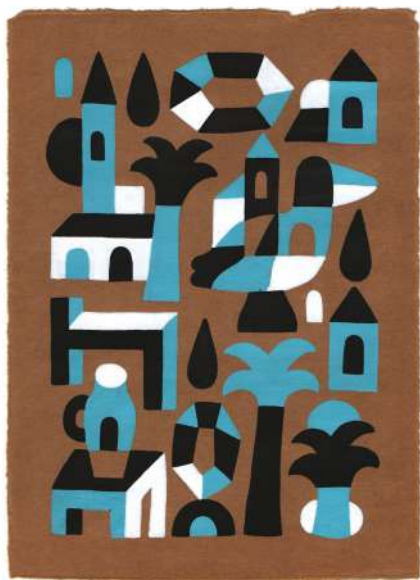
Obra de Nacho González

Desde pequeño siempre supo que quería dedicarse al mundo del dibujo. Con 13 años comenzó a pintar grafiti con los amigos de su ciudad, y más tarde decidió empezar a tatuar.