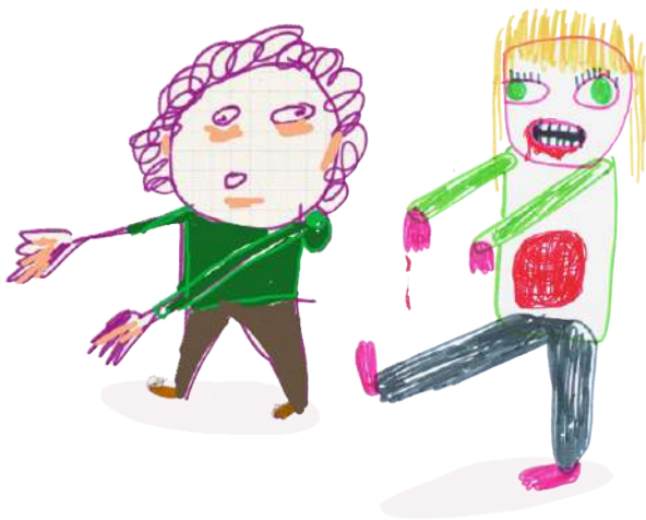
Autorretrato de “Sois de Traca”